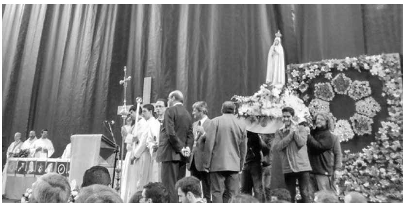
Dia Diocesano da Juventude, Gondomar, 23 de abril