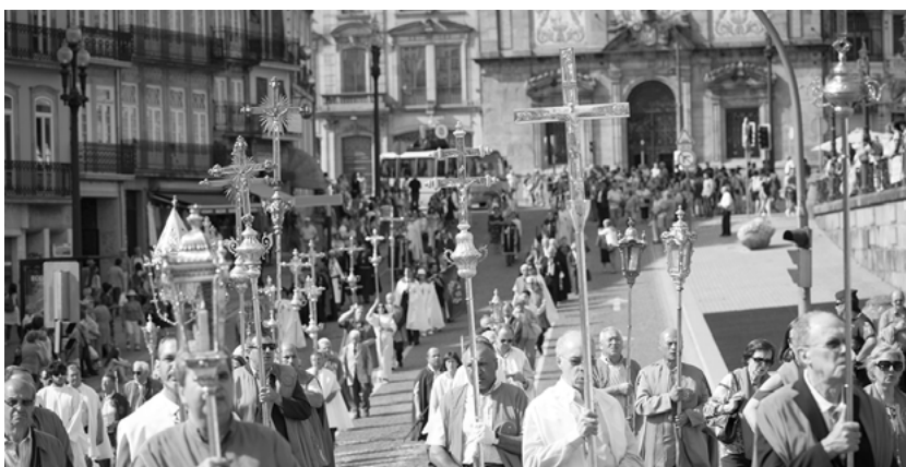
Procissão do Santíssimo Corpo e Sangue de Cristo, 26 de maio