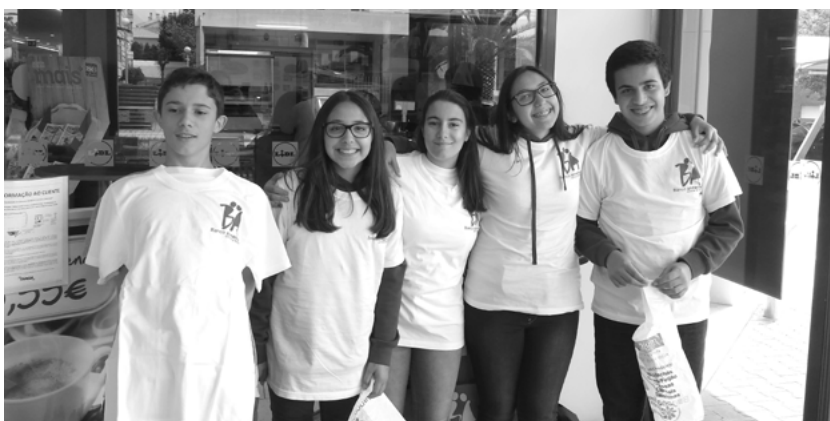
Grupo de Acolitos Senhora do Porto no Banco Alimentar, 28 e 29 de maio