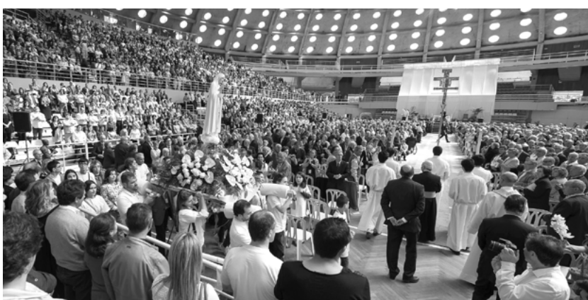
Dia Diocesano da Família, 24 de abril